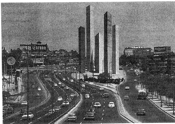
Las "Torres de Satélite" señalan el arranque de la autopista de México a Querétaro.

nacional. En este último aspecto destacaron la creación de empresas como "Altos Hornos de Monclova" (después "de México"), la siderúrgica "Lázaro Cárdenas" en Michoacán, y el impulso a la Comisión Federal de Electricidad a la que se incorporaron en 1960 las empresas locales del ramo y la Compañía de Luz y Fuerza del Centro, adquiridas por el gobierno. También se contaban entre las empresas estatales, entre otras, minas de plata, carbón, cobre y de mineral de hierro.