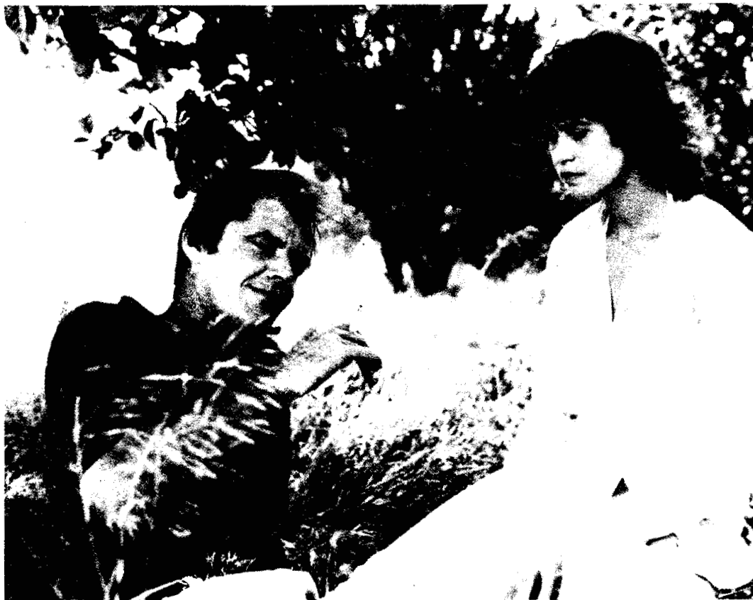
Jack Nicholson y Maria Schneider en El reportero, de Michelangelo Antonioni (1974).

talmente el proceso de formulación de hipótesis referentes a los personajes (véase De repente, el último verano ). Existen, por otra parte, casos mixtos o ambiguos. En Hasta que llegó su hora , algunas imágenes sólo poco a poco son identificables como flash-backs y pasan del estatuto asociativo-subjetivo-enigmático al explicativo-causal (puesto que ofrecen, en su estado final, la clave del comportamiento de Charles Bronson). En Andrei Rubliev (Andrei Rubliov, 1966) se encuentra un caso de flash-back muy fluido, que acumula funciones explicativas (recuerda una felonía del hermano del gran duque al aliarse con los tártaros para entregarles una ciudad rusa) y asociativas en sentido amplio (las imágenes pueden referirse al hermano felón, a las víctimas de su traición o a la narración). 72 Antonioni se ha hecho especialista en flash-backs «subjetivos indirectos libres» —por emplear la expresión propuesta por Pasolini—, los cuales, de algún modo, se deslizan de lo objetivo a lo subjetivo. En El reportero , Jack Nicholson, después de haber descubierto el cadáver de su vecino en una habitación de hotel en África, está instalado en su mesa para intercambiar las fotos de los pasaportes (quiere adoptar la identidad del muerto):