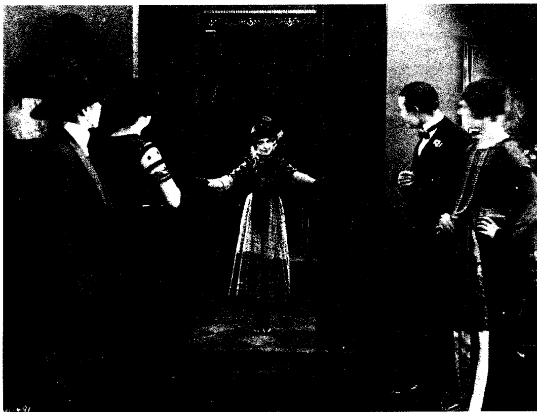
Las dos tormentas, de D.W. Griffith (1920)

como una riada que lo arrasa todo, como sucede por ejemplo en las secuencias finales de La madre de Gorki, en Zarkhi , o Pudovkin». 62 Sin embargo, en Alexander Nevski Eisenstein realizará una especie de síntesis de lo épico y lo dramático. El hielo está estrechamente integrado en la progresión dramática (forma parte de la estrategia de combate de Alexander, que cuenta con atraer a los caballeros teutónicos, sobrecargados por sus armaduras, sobre el hielo todavía frágil); la escena se revela larga (¿estaba esto previsto desde el estudio de guión?) y por su propia duración se desliza de lo dramático a lo poético y a lo épico (la Naturaleza se encuentra de nuevo aliada a fuerzas «progresistas»). Es más bien por la dilatación temporal —y no por la discontinuidad narrativa y el montaje paralelo— por lo que Eisenstein sugiere (más que formula) para la escena un sentido que desborda su alcance dramático.