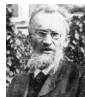
Clasificación climática de Köppen

La clasificación climática más usada en nuestros días es la de Wladimir Meter Köppen (Rusia, 1846-1940), quien tomó como base la temperatura atmosférica y las precipitaciones pluviales como vemos a continuación: